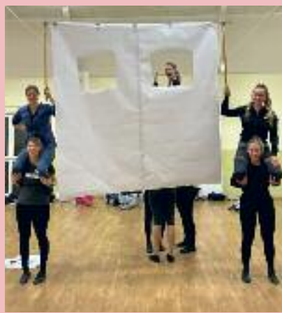
...und viel Spaß gehört dazu