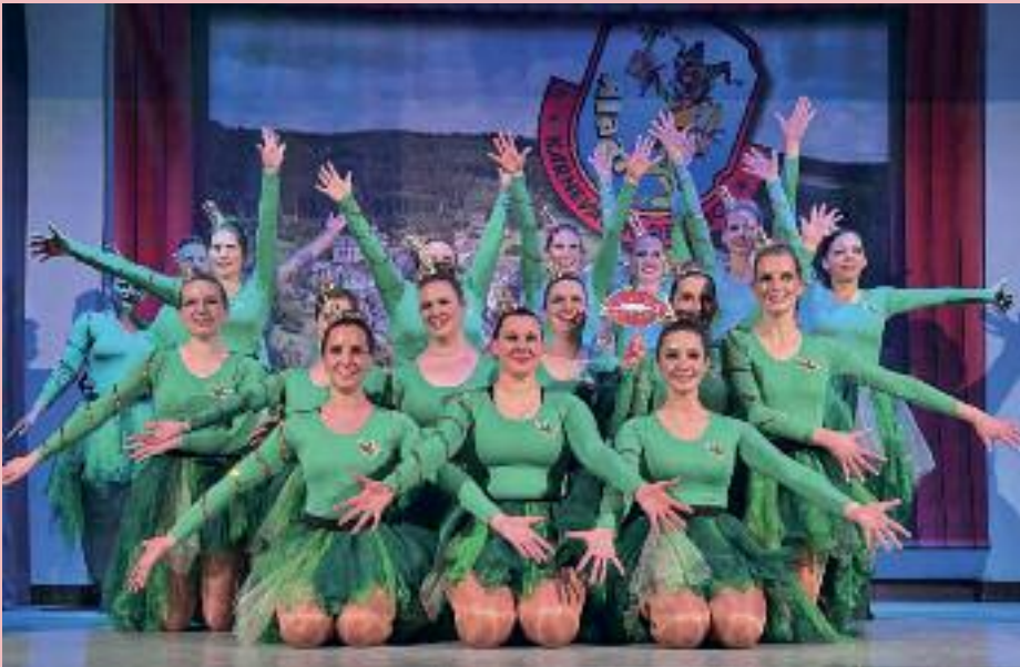
Sitzung 2025 – Showtanz zum Thema „ Küss den Frosch“