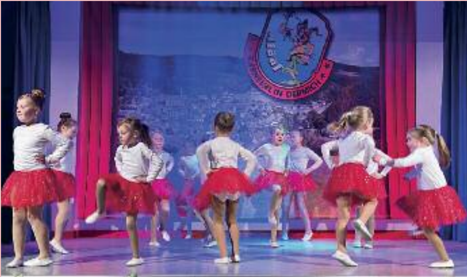
Die Minis werden schon früh an den Tanzsport herangeführt