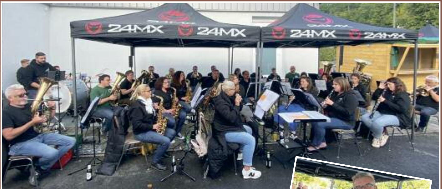
Der Musikverein Dermbach sorgte für gute Stimmung auf dem Platz