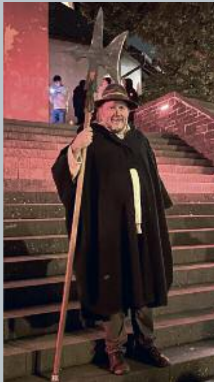
Nach einer guten Grundlage ging es dann auf die interessante Tour durch die Altstadt