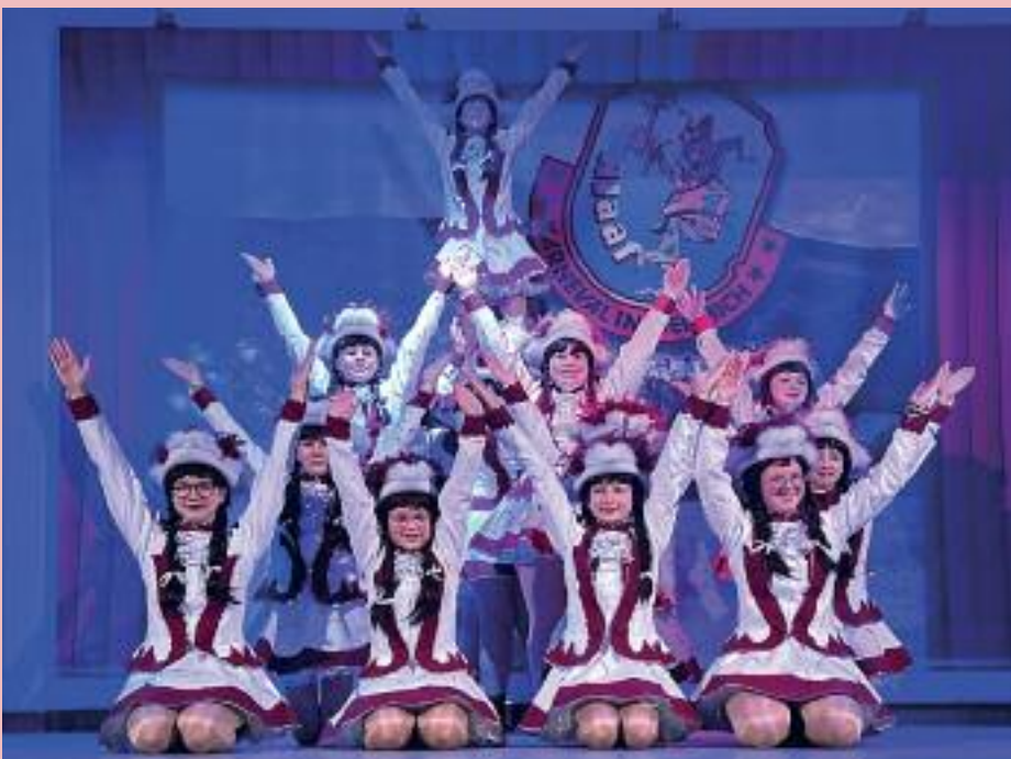
Mit viel Schwung und Hebefiguren zeigt die Teenie-Tanzgruppe ihr ganzes Können

VfL Dermbach bewegt und verbindet Generationen seit über 125 Jahren