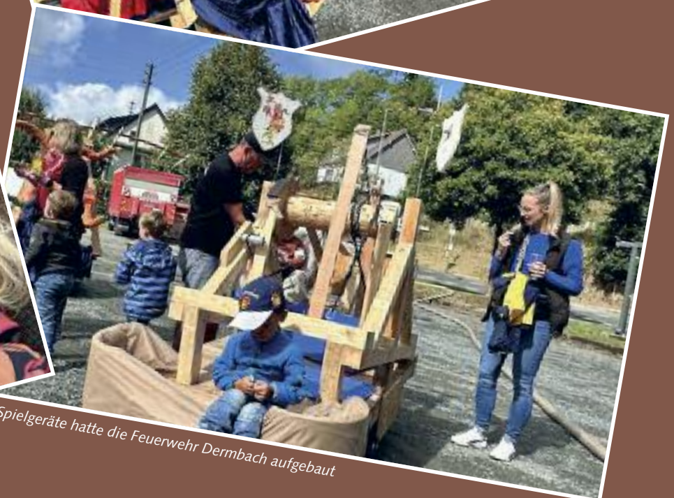
Tolle Spielgeräte hatte die Feuerwehr Dermbach aufgebaut