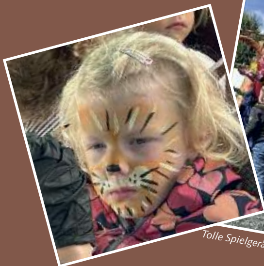
Beim Kinderschminken war immer Hochbetrieb