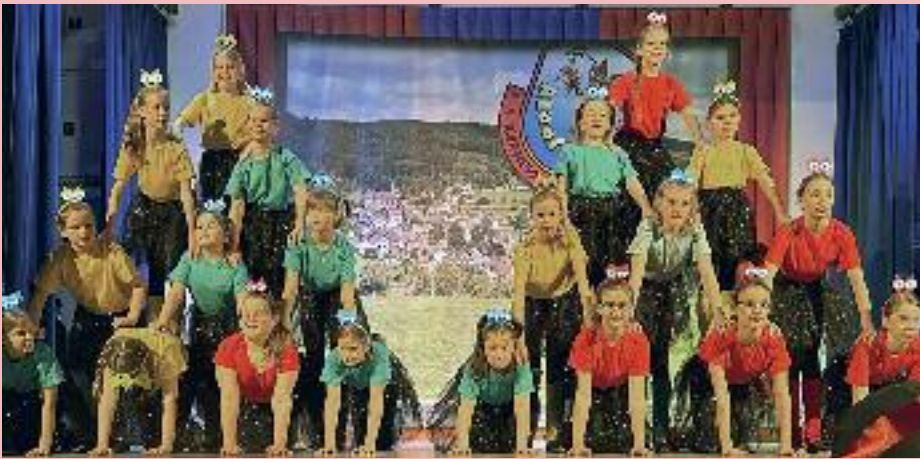
Souverän bewegt sich die Kindertanzgruppe schon über die Bühne