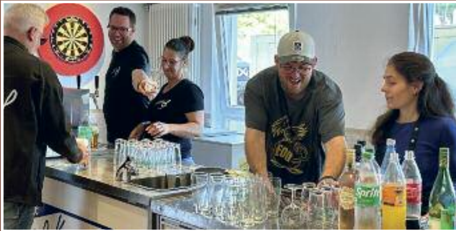
Getränke verteilen, zapfen, spülen, kisten schleppen – gemeinsam macht es Spaß