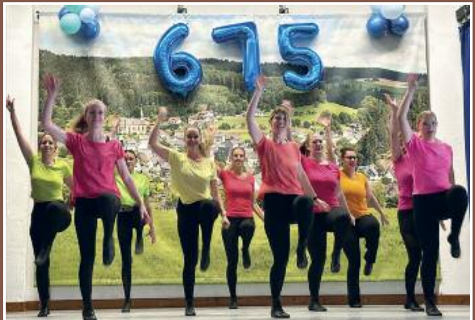
Eine fetzige Tanzvorführung der VfL-Tanzgruppe durfte natürlich nicht fehlen