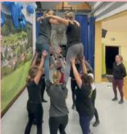
Vertrauen ist angesagt...