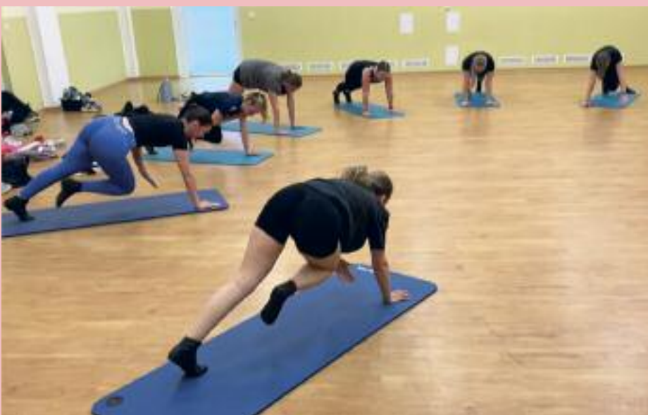
Beweglichkeit und Kondition – die Basis auch beim späteren Tanzen