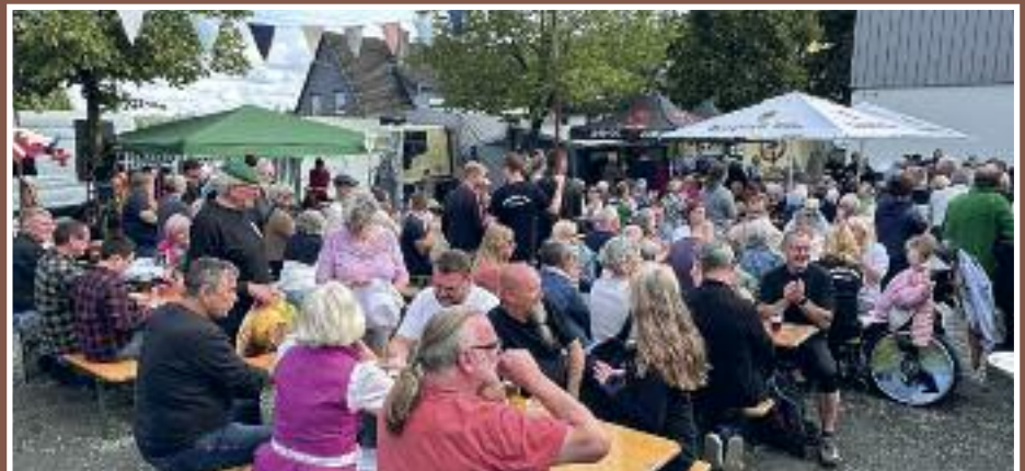
Viele Aktivitäten in der Mehrzweckhalle und auf dem Platz sorgten für ein abwechslungsreiches Programm. Speis und Trank, ließen sich die zahlreichen Festbesucher schmecken