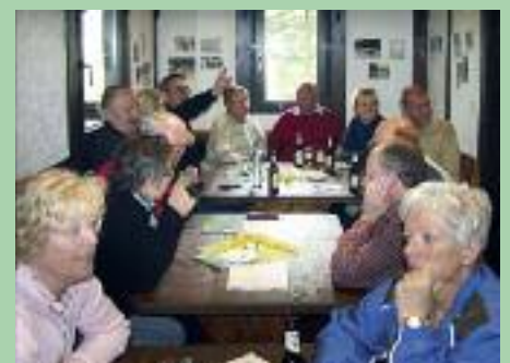
Von der Maiwanderung im Jahr 2006 stammen diese beiden Fotos. Zu diesem Zeitpunkt fand der Abschluss immer in der Hans-Straßer-Hütte statt.

Auch in 2026 starten wir natürlich wieder zur traditionellen Maiwanderung mit Abschluss im Stüffjen