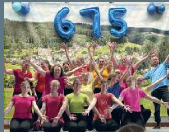
675 Jahrfeier Dermbach – Tanzvorführung der VfL Tanzgruppe

Wettkampfsport im Tischtennis und Rhönradturnen, dazu die zahlreichen Aktivitäten im Breitensport, für fast alle Altersgruppen bietet der VfL ein attraktives Angebot.