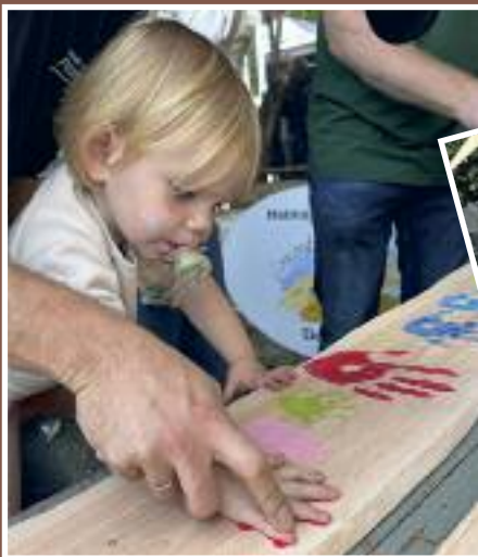
Ein nachhaltiger Farbadruck als Erinnerung