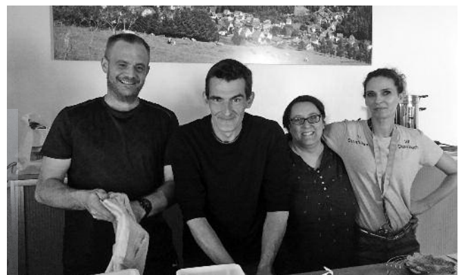
Das Bewirtungsteam im Stüffjen