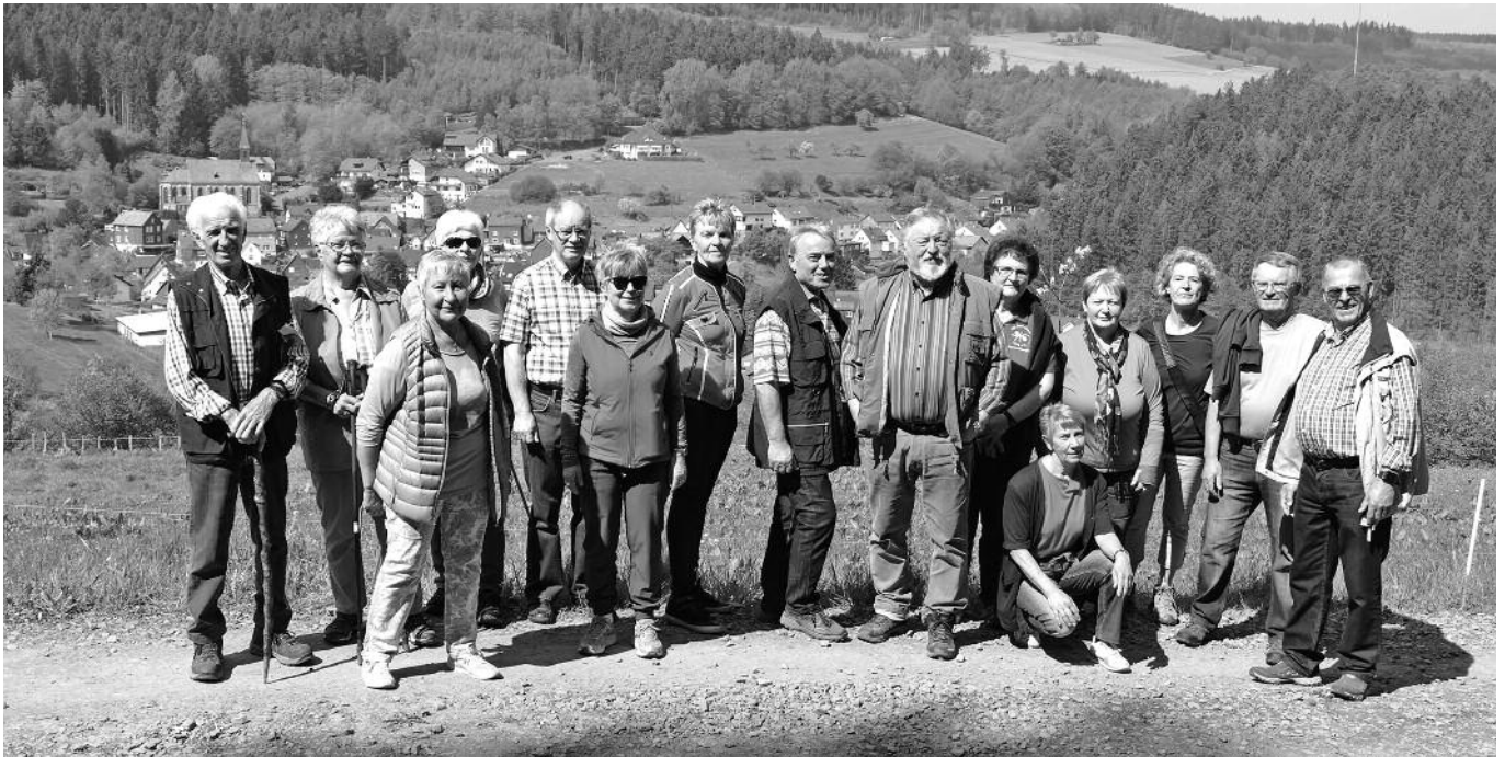
Die Wandergruppe vor der Bollnbach...