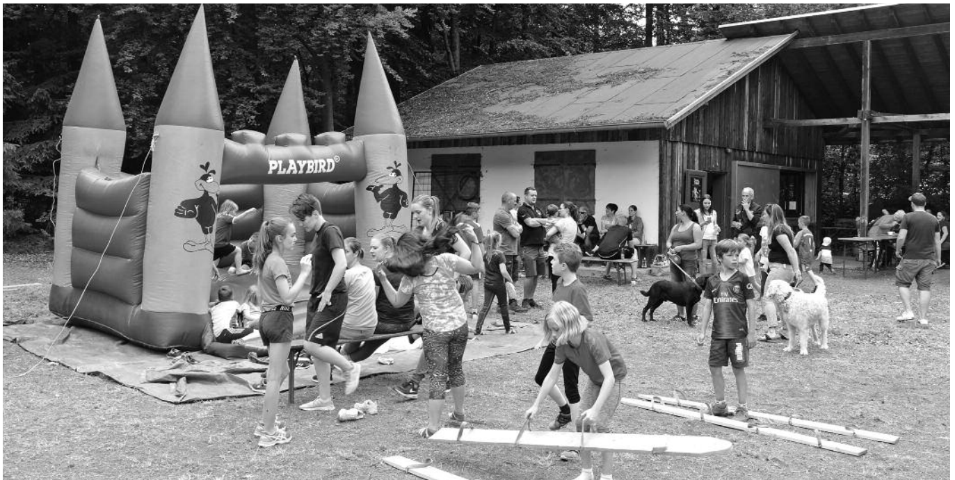
Die Hüpfburg wurde von den Kindern mit Begeisterung genutzt