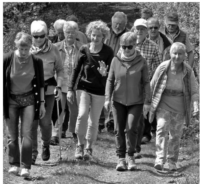
... und in Wald und Flur